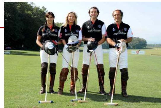
Exemple d'équipe sponsorisée (JLC Polo Masters)