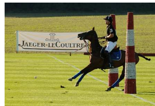
Exemple de banderole (JLC Polo Masters)