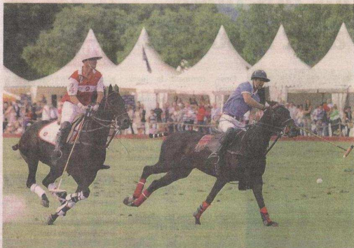
Les parties de polo seront acharnées samedi et dimanche au Polo club de Veytay à Mies.