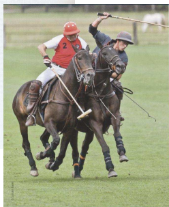
Texte: Polo Club de Veytay

POLO CLUB DE VEYTAY Saison 2011 Un bilan plus que satisfaisant. Eine mehr als zufriedenstellende Bilanz