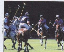
Un temps de réve, notamment pour les finales du 28 août, des matches font dispute, la présence de Zao, invité à présenter le Reverseo de Têlé, et plus de 5'000 spectateurs: quel succès!