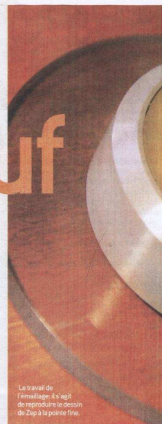
Le travail de l'émaillage: il s'agit de reproduire le dessin de Zep à la pointe fine.

Z Non. Il y en avait peu car le système de reproduction dont dispose la manufacture copie parfaitement l'image couleur que je leur ai fournie. La montre est en or rose, le motif en émail, protégé par deux volets qui se rapprochent par le milieu et le mot Reverso apparaît en minuscules sur le rouge. Ce sera